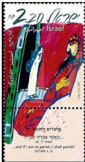
אחשוורוש ואסתר (2007)

במשך היום לובש, עולם התדמיות והקליפה שאנו מתכסים בה ביום יום.