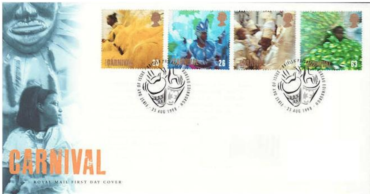
בולי קרנבל על מעטפת יום ראשון מאנגליה

אפשר וניתן להקביל את חגיגות הקרנבל הנוצריות על תחפושותיהם לחגיגות הפורים היהודיות. ראשית הן נערכות בזמנים מקבילים אחד לשני: לרוב ההפרש בין החגיגות יהיה חודש לכל היותר והן נערכות כ-40 יום לפני חג הפסח והפסחא. כמו כן, על כולם מוטלת חובת השמחה, השתייה והאכילה המרובה. בשתי החגיגות נוהגים לערוך תהלוכה גדולה ורבת משתתפים לאורך רחובותיה הראשיים של העיר בה נערכת החגיגה. תהלוכת פורים זו ידועה בשם "עדלאידע" ובשנים האחרונות יותר ויותר ערים ברחבי הארץ עורכים תהלוכה שכזו בקרב התושבים, אשר מצדם יוצאים מחופשים, שמחים ועליזים לרחובות העיר השמחה והצהלת. כנראה שלכל החגים היה חג משותף קדום אחד שמטרתו היה לציין את המעבר מהחורף לאביב, או, לחילופין, לספק שעשוע בימי החורף הקרים.