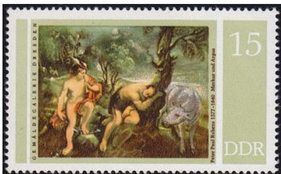
פיטר פ. רובנס: מרקור (הרמס) וארגוס

הרה לא נפלה במלכודת וביקשה מזאוס את הפרה כמתנה וזה העניק לה אותה מכיוון ולא רצה לעורר את חשדה. הרה מינתה את ארגוס, הענק בעל מאה העיניים, לשמור על איו הפרה רחוקה מזאוס. משרצה זאוס להציל את איו, פקד על הרמס, שליח האלים, להרוג את ארגוס ולשחרר את הפרה. הרמס הצייתן ניגן לארגוס בחלילו ואף סיפר לו סיפורים בכדי להרדימו. משזה נרדם, הרגו הרמס באבן ושילח את איו לחופשי. כששמעה הרה על התקרית נחרדה ממותו של ארגוס, ובכדי לשמר את זכרו שתלה את מאה עיניו בזנבו של טווס ומאז מתהלכים הטווסים ומזכירים את סיפור אהבתם של איו וזאוס.