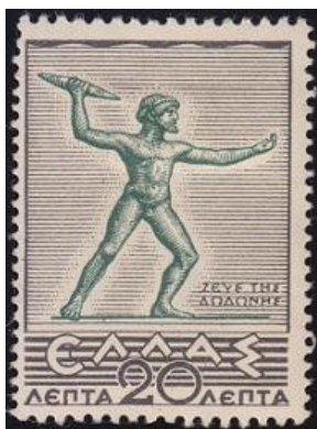
זאוס – אבי האלים

זאוס הוא אבי האלים האולימפיים, אל השמים ומטיל הברקים והרעמים. כאל העליון אחראי זאוס על המשפט והצדק בקרב בני האדם והאלים. לזאוס היתה תכונה מגונה והיא חיבתו הרבה לנשים (ולפעמים, לגברים). זאוס לא היסס להשיג כל אשה בה חשק, תהה זו בתו, אחותו, אלה שמימית, בת-תמותה, רווקה או נשואה, וכל זאת, למורת רוחה של אשתו החוקית, הרה. לא פלא, אם כן, כי זאוס הוא אביהם של לא פחות מאלף צאצאים מנשים שונות.