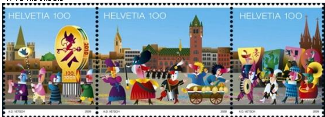
קרנבל מסכות משוויץ

זו לא התחלה של סיפור מאת שייקספיר, אלא תיאורו של נשף מסכות אירופאי בימי הביניים. נשפים כאלו נערכו לעיתים תכופות בכל רחבי אירופה החל מהמאה ה-13 ובייחוד בתקופת הרנסאנס, במאות ה-14 עד ה-17. כל בית מלוכה, נסיכות או אצילות הרבה בעריכת נשפים כאלו ואף התחרה מי עורך את הנשף הגדול ביותר, המרשים או המרהיב ביותר. הנשפים החלו כחגיגה גדולה של ריקודים, אוכל ושתייה שנועדה לבשר את תחילת 40 ימי הצום שלפני חג הפסחא. מחגיגות דתיות אלו, הפכו הנשפים לאירועים אקסקלוסיביים יותר, נוצצים יותר והרבה פחות בעלי אופי דתי.