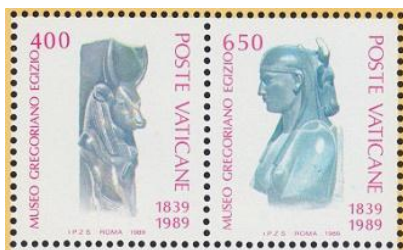
האלה המצרית איזיס ובנה השור המצרי הקדוש, אפיס, מקבילהם של איו ואפסוס

הבוספורוס ("מעבר הפרה"). כשהגיעה איו הפרה להרי הקווקז היא פגשה בפרומתאוס, בורא בני האדם, שנאסר בשלשלאות על ידי זאוס כעונש על שלימד את האדם להבעיר אש ועל כך שהונה אותו והגיש לו ממנחת בני האדם רק את העצמות. יום יום היה מגיע נשר ומנקר בכבדו של פרומתאוס. למרות