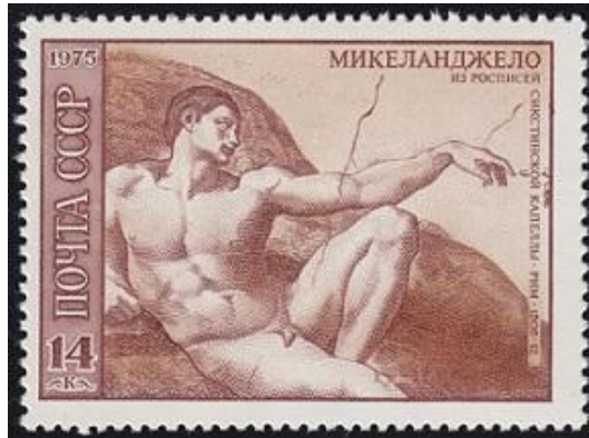
פרט מיצירתו של מיכלאנג'לו מתקרת הקפלה הסיסטינית

בבול מברית המועצות שלפניכם מתואר פרט מיצירה מפורסמת של מיכלאנג'לו מתקרת הקפלה הסיסטינית שכותבו עליה בקצרה.