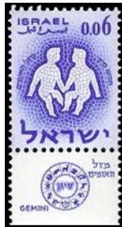
צמד התאומים כמערכת כוכבים

אחותם הלנה מידיו של תזאוס, מלך אתונה, וסייעו להרקולס במלחמתו באמזונות. הם חטפו את בנותיו של המלך לאוקופיוס, שבהן רצו כנשים ונהרגו לבסוף בקרב שערנו נגד אוקס ולוקאוס. בשמיים הם ניצבים כקונסטלצית (מערכת כוכבים) התאומים (Gemini).