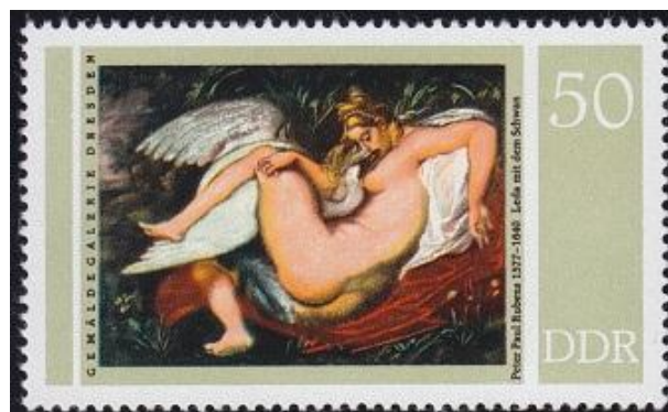
פיטר פ. רובנס (ימין) וליאונרדו דה-וינצ'י (שמאל): לדה וזאוס בדמות ברבור

באותו ליל כלולות בילתה לדה גם עם בעלה החדש, טינדראוס. כעבור תשעה חודשים הטילה לדה שתי ביצים שמהאחת נולדו ילדי זאוס, פולוקס והלנה (אותה הכרנו ממאמרנו הקודם "משפט פאריס") ומהשנייה נולדו ילדי טינדראוס, קסטור וקליטמנסטרה. שני התאומים, פולוקס וקסטור, הנקראים גם דיוסקורי ("בני האלוהים"), השתתפו בהרפתקאות רבות. הם יצאו למסע הארגונוטים, הצילו את