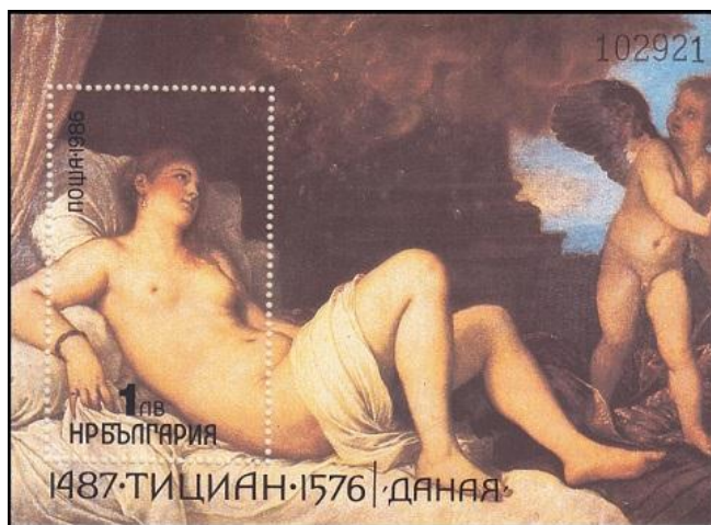
טיציאן (ימין) ורמברנדט (שמאל): דנאה וזאוס בדמות גשם פתיתי זהב

פרי אהבתם היה בן בשם פרסאוס. המלך-הסב, שחשש מנבואת האורקל, כלא את בתו ונכדו בתיבה והטיל אותה אל הים. לבקשת זאוס, הרגיע פוסידון, אל הים, את הגלים והתיבה נסחפה אל האי סריפוס, שם משה אותה מן המים דייג טוב לב בשם דיקטיס שגידל את פרסאוס כבנו.