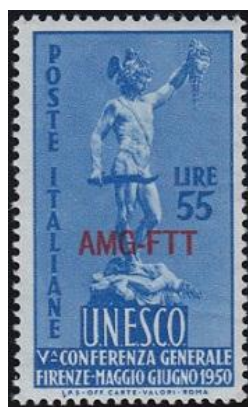
בנונוטו צ'ליני: פרסאוס ומדוזה

מלך האי ואחי הדייג, פולידקטס, שבניגוד לאחיו היה רשע מרושע, התאהב בדנאה וביקש לשאתה לאישה בניגוד לרצונה. פרסאוס ביקש מהמלך להמתין עד שיוכל להביא לו מתנת כלולות. הוא יצא למקום משכנן של הגורגונות להביא את ראשה של המדוזה, שכל מי שראה אותה הפך לאבן. האלה אתנה נתנה לו מגן, הרמס העניק לו חרב חדה והאלים העניקו לו סנדלים מכונפים. בעזרתם הצליח פרסאוס לכרות את ראשה של המדוזה, לשים בתיקו ולעוף חזרה לאי סריפוס. בדרכו חלף מעל יפו, שם ראה את אנדרומדה קשורה לסלע, הרג את הדרקון, שעמד לטרוף אותה ושחרר אותה מכבליה. הוא נשא אותה לאישה וחזר יחד עימה לאי סריפוס. בשו בו לאי, נכנס פרסאוס למשתה המלך והוציא את ראשה של המדוזה מתיקו.