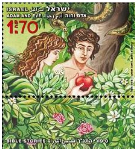
אדם וחוה אוכלים מעץ הדעת (2010)

החטא של אדם הראשון היה חטא של החלפה בין העצם – עצמות, עצמיות (אדר) לבין הלבוש (אדרת). לפני חטא האדם הראשון כתוב שאדם וחוה היו ערומים ולא התבוששו. מבחינה פנימית משמעות הדבר היא שלא היה פער בין המהות של האדם הראשון לבין הלבוש שלו – העולם החיצוני שלו.