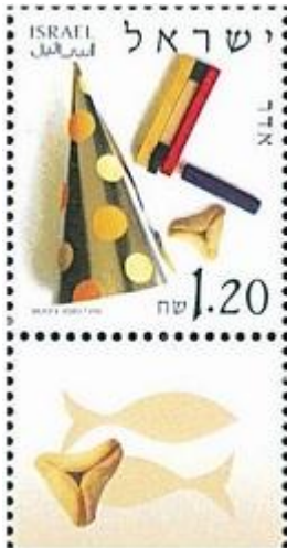
בול חודש אדר (2002)

במאמר זה נבאר את משמעות המילה אדר וניתן לה עומק חדש לקראת פורים החל החודש. הפרושים המקובלים למילה אדר הם: