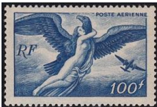
זאוס בדמות עיט חוטף את אויגינה

אויגינה היתה נימפה יפהפיה בתו של אל הנהר, אסופוס. כה יפה היתה שגם זאוס, אבי האלים, לא יכל לעמוד בפניה. הוא עטה דמות עיט וחטף אותה לאי ליד אתיקה שנקרא אחר כך על שמה. אביה אסופוס רדף אחריהם אך זאוס שלח בו את ברקיו והחזירו לנהר מקום משכנו. מאהבתם של זאוס ואויגינה נולד אייקוס שהפך לשליט האי. הרה הקנאית,