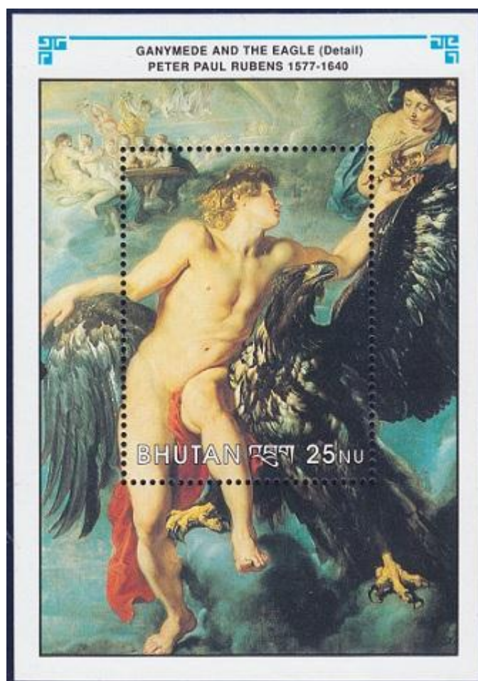
פיטר פ. רובנס: חטיפת גנימדס ע"י זאוס בדמות עיט

לא רק בנשים חשק זאוס כי גם בגברים. הסיפור הידוע ביותר הוא סיפורו של גנימדס, בנו של טרוס מלך טרויה, הנער היפה ביותר בעולם. לאחר שהבה (Hebe), נושאת גביע האלים, התחתנה עם הרקולס, חיפש זאוס נושא כלים חדש שיחליפה. משראה את גנימדס משחק עם חבריו על הר אידה, לא יכל זאוס לשלוט ברגשותיו, התאהב בו ורצה להביאו כדי שיחיה בקרבתו ובקרבת האלים. זאוס עטה דמות עיט גדול וחטף את גנימדס להר האולימפוס, שם הוא הפך למשרת ולמגיש הנקטר לאלים. כפיצוי לאובדן בנו, שלח זאוס לטרוס המלך זוג סוסים בני אלמוות וכן הובטח לו כי בנו ישאר צעיר לנצח. ואכן, עד היום נשאר גנימדס, משרת האלים, צעיר ויפה תואר כביום חטיפתו על ידי זאוס, אבי האלים וחובב הנשים והגברים.