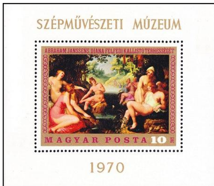
אברהם יאנסנס: דיאנה (ארטמיס) וקליסטו

קליסטו הייתה נימפה ידועה ביופייה, בת לווייתה של ארטמיס (דיאנה), אלת הצייד, שדרשה מהנימפות לנדור כי ישמרו על בתוליהן. זאוס, משראה את קליסטו נדהם מיופיה והתאהב בה, אולם היא לא שעתה לחיזוריו הרבים. ביאושו, עטה זאוס על עצמו את דמותה של ארטמיס והמשיך לחזר אחריה. קליסטו התמוגגה מנחת אל מול חיזורי האלה ארטמיס הנערצת עליה ורק באיחור רב הבינה כי רומתה.