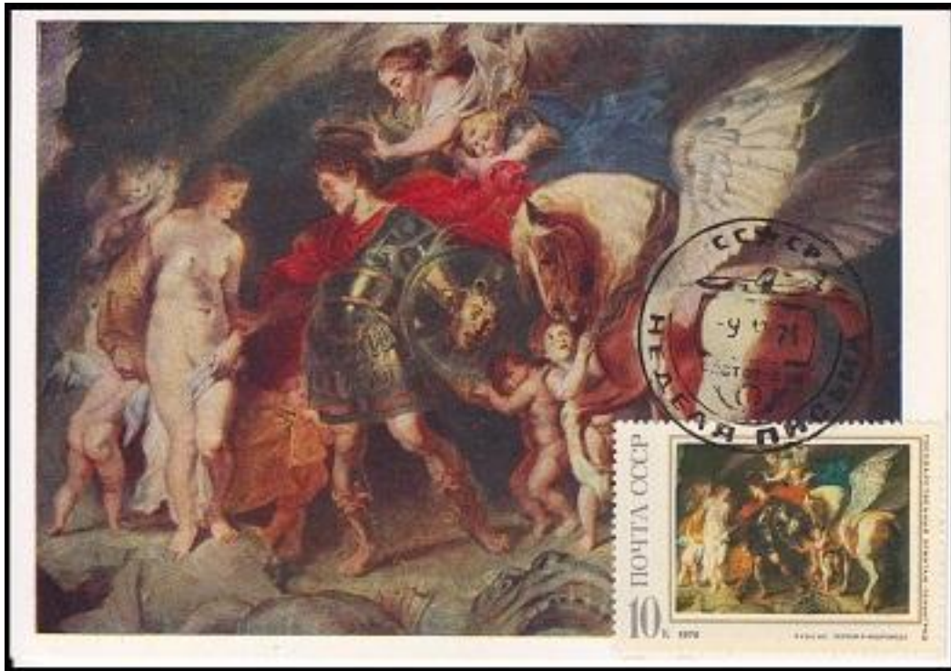
פיטר פ. רובנס: פרסאוס ואנדרומדה (גלוית מירב)

בדרכם הביתה התעכבו השלושה לתחרויות ספורט בעיר לריסה. פרסאוס השתתף בתחרויות וכשהשליך דיסקוס הוא פגע באחד הצופים בטעות והרגו. היה זה סבו אקריסיוס, שניסה למנוע את נבואת האורקל שניבא שנכדו יהרוג אותו.