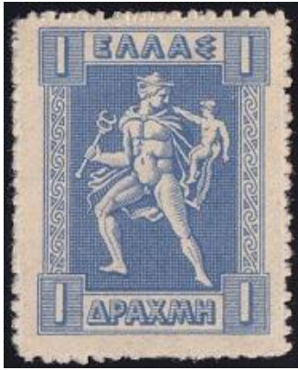
ארקאס נישא בידי הרמס

יום אחד, בעת שרחצה קליסטו בנהר, התגלה דבר הריונה. מכיוון והפרה את נדרה, גורשה קליסטו בבושת פנים מחברת הנימפות על ידי האלה ארטמיס. כעבור מספר חודשים הסתיים הריונה בלידת בנה ארקאס. הרה, אשת זאוס, שגילתה את דבר הבגידה ולידת הבן הלא חוקי לבעלה, נקמה בקליסטו והפכה אותה לדובה.