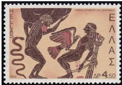
הנשר מנקר את כבדו של פרומתאוס

איו הפרה לא נתנה מנוח להרה וזו, ברצונה להמשיך ולהתנקם בה, שלחה זבוב בקר שעקץ אותה ללא הפסקה והביאה עד לכדי שגעון. איו חסרת המנוחה החלה בנדודים והגיעה עד לחופי טורקיה למקום שקיבל את שמה – איוניה. משם חצתה את המצר בין ים המרמרה לים השחור שנקרא עד היום על שמה –