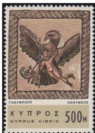
חטיפת גנימדס, פסיפס מפאפוס, קפריסין

לא רק בנשים חשק זאוס כי גם בגברים. הסיפור הידוע ביותר הוא סיפורו של גנימדס, בנו של טרוס מלך טרויה, הנער היפה ביותר בעולם. לאחר שהבה (Hebe), נושאת גביע האלים, התחתנה עם הרקולס, חיפש זאוס נושא כלים חדש שיחליפה. משראה את גנימדס משחק עם חבריו על הר אידה, לא יכל זאוס לשלוט ברגשותיו, התאהב בו ורצה להביאו כדי שיחיה בקרבתו ובקרבת האלים. זאוס עטה דמות עיט גדול וחטף את גנימדס להר האולימפוס, שם הוא הפך למשרת ולמגיש הנקטר לאלים. כפיצוי לאובדן בנו, שלח זאוס לטרוס המלך זוג סוסים בני אלמוות וכן הובטח לו כי בנו ישאר צעיר לנצח. ואכן, עד היום נשאר גנימדס, משרת האלים, צעיר ויפה תואר כביום חטיפתו על ידי זאוס, אבי האלים וחובב הנשים והגברים.