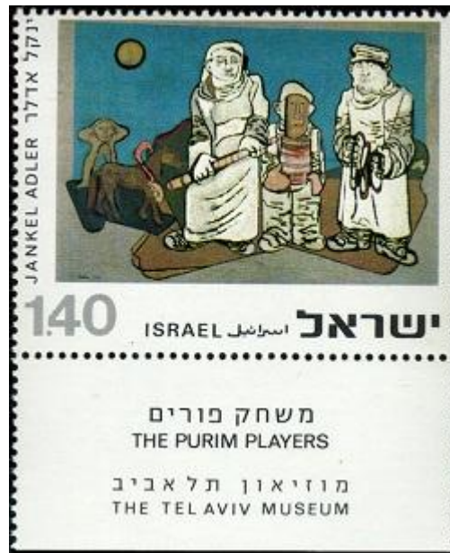
משחקי פורים (1975)

פורים שמח! בעוד שבועיים נחגוג את החג עם תחפושות, משלוחי מנות, תהלוכות ומסיבות. לכבוד החג הכנו עבורכם גיליון פורימי במיוחד.