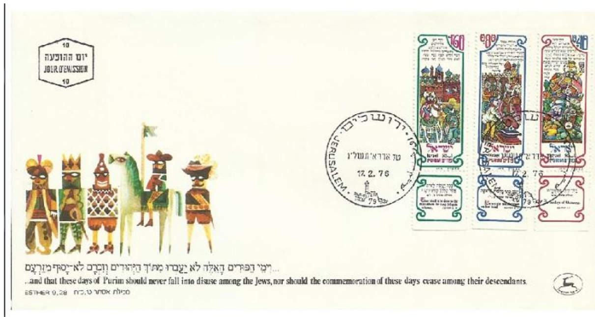
מעטפת יום ראשון פורים (1976)

יוצא שאדר מלשון עצם ומלשון לבוש זה דבר אחד – חיבור של הנגלה והמכוסה. התחפושת שמתחפשים בפורים יש בה מעין שעשוע של ללבוש דבר מה, שלא רק שלא מרחיק אותנו מהמהות שלנו, אלא מחזיר אותנו למהות הפנימית שלנו.