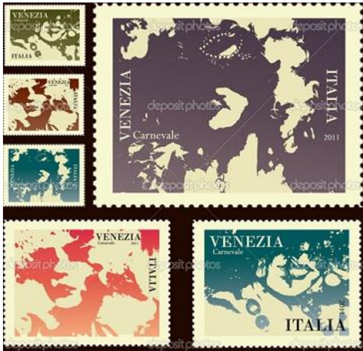
דמויות מנשף המסכות בונציה

הללו הפכו לאירועים המוניים הפתוחים לכולם, נשפים בהם השתתפו בני כל המעמדות, מחופשים בתחפושות שונים, רוקדים, שותים ונהנים.