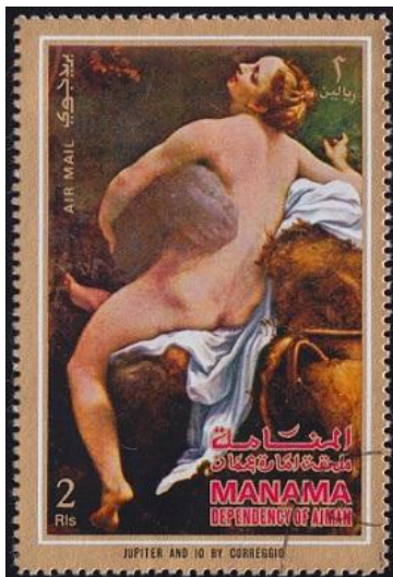
קורג'יו: איו וזאוס כענן

במרבית המקרים היה נוהג זאוס להפגש עם הנשים בהן חשק תוך שהוא עוטה דמות כלשהיא בכדי לטשטש את זהותו. בין שלל הדמויות אותן עטה היו שור, ענן, ברבור, עיט, גשם זהב, בן-אנוש ועוד. הסיפור המפורסם ביותר הוא חטיפתה של הנסיכה אירופה על ידי זאוס כשהוא עוטה דמות שור לבן אותו סיפרנו בהרחבה במאמר קודם . במאמר זה נוסיף ונספר עוד משלל אהבותיו ובגידותיו של זאוס, אבי האלים.